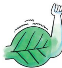
Boostar näringsämnenas effektivitet