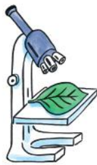
Stimulerar plantans egna processer för att stå emot abiotisk stress