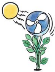
Hjälper till att hålla plantan frisk under varma förhållanden

QUANTIS förbättrar plantans förmåga till att svara på stress genom att upprätthålla saftspänningen och neutralisera skadliga radikaler, vilket hjälper plantan att hålla igång fotosyntesen och därmed produktionen av avkastning.